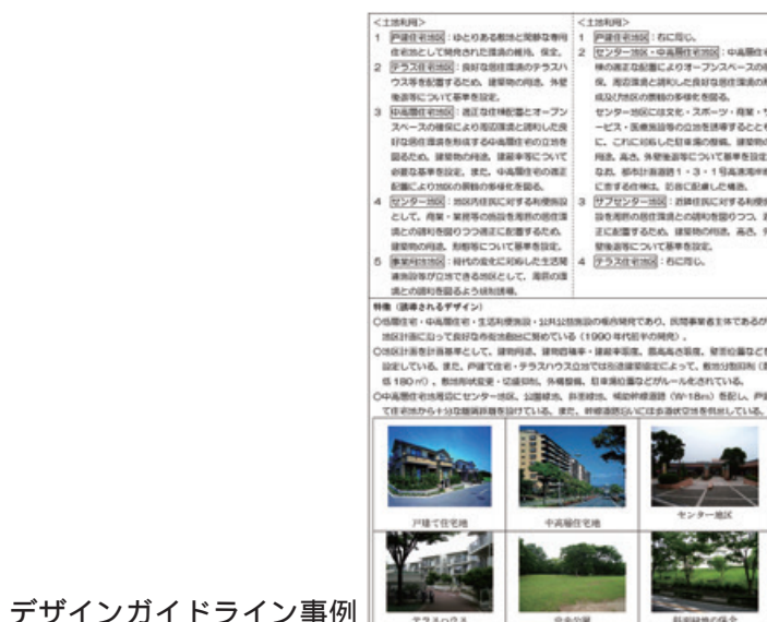
デザインガイドライン事例