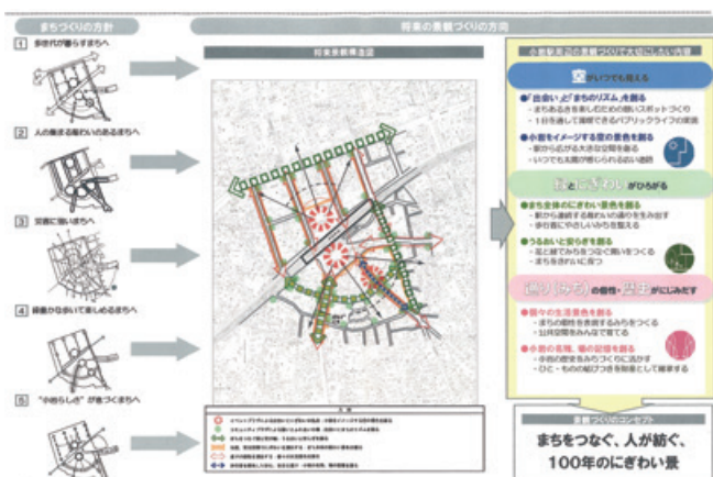
まちづくり景観コンセプト